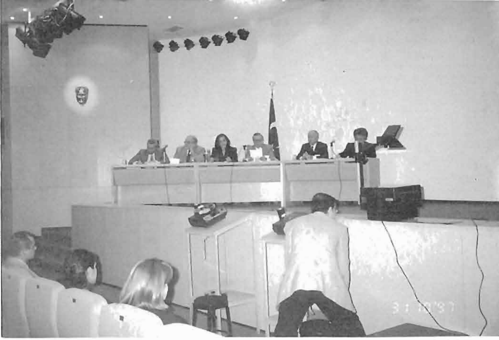
Resim 5: Ortodontide Mezuniyet Öncesi ve Sonrası Eğitim ve Sorunları Paneli.