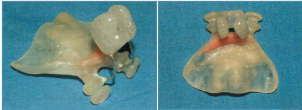
Figure 4. Nasoalveolar Molding Plate (side view and top view)

Şekil 4. Nazal ve alveoler şekillendirme plağı (yandan görünüm ve yukarıdan görünüm)